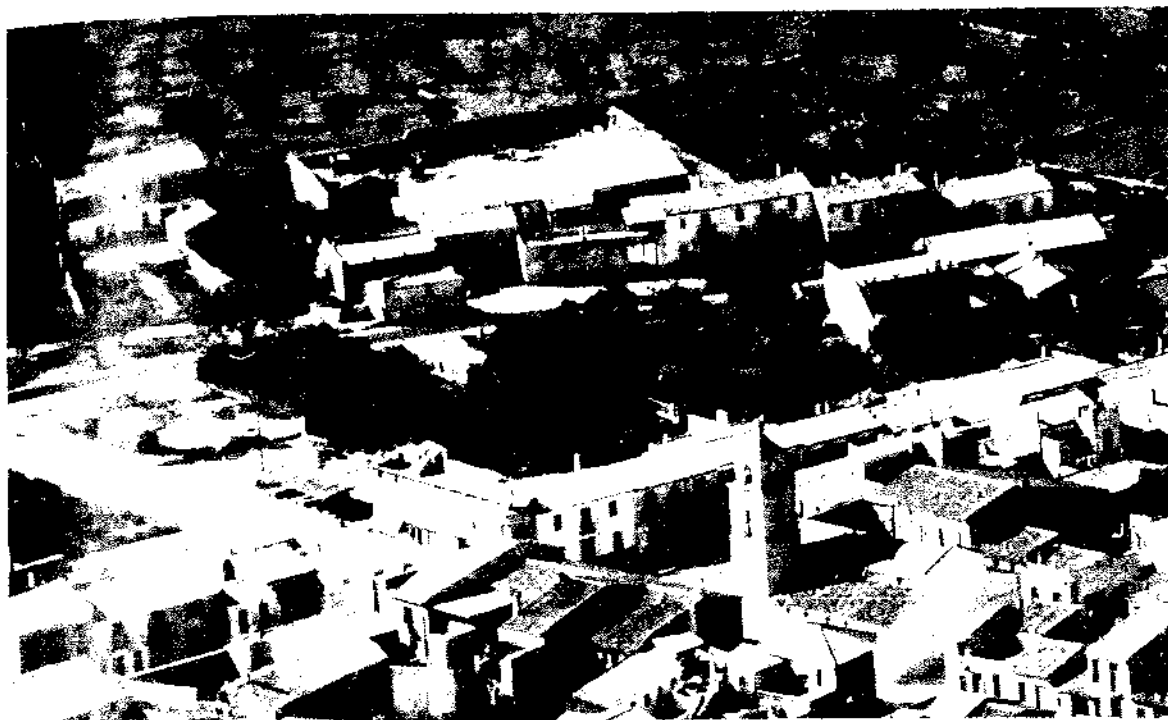
La Plaça del Poble, el metro i la venta (any 1962)