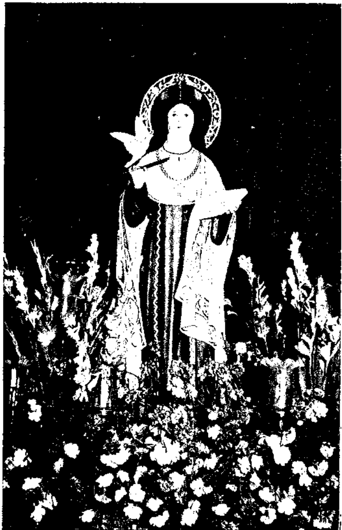
SANTA TERESA DE JESUS Doctora de la Iglesia Titular de la Parroquia