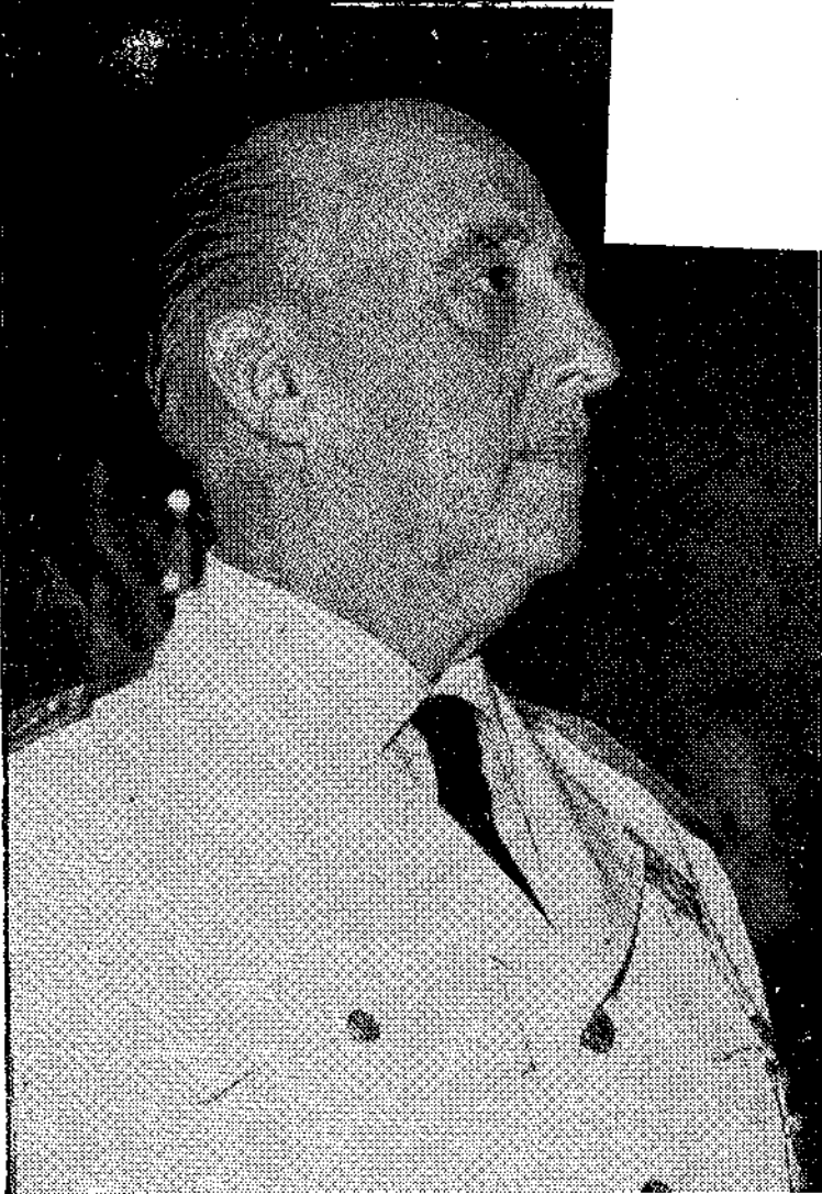
S. E. el Generalísimo D. FRANCISCO FRANCO BAHAMONDE Jefe del Estado Español