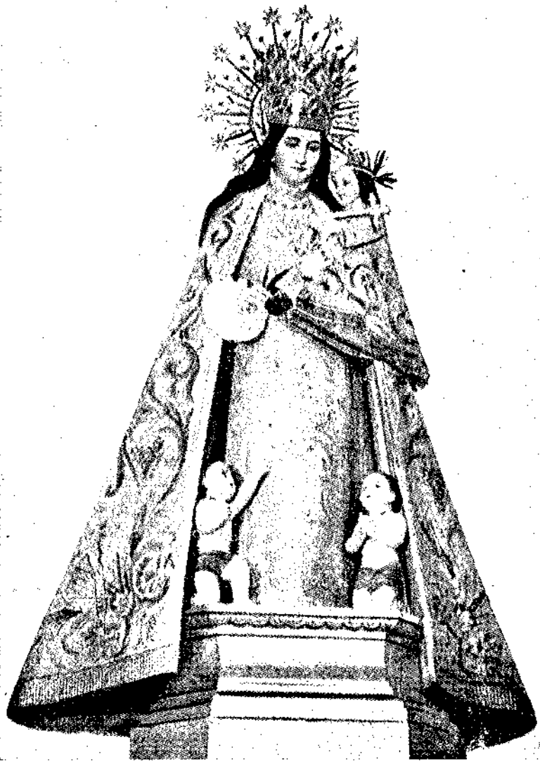
LA VIRGEN DE LOS DESAMPARADOS Patrona de Campello