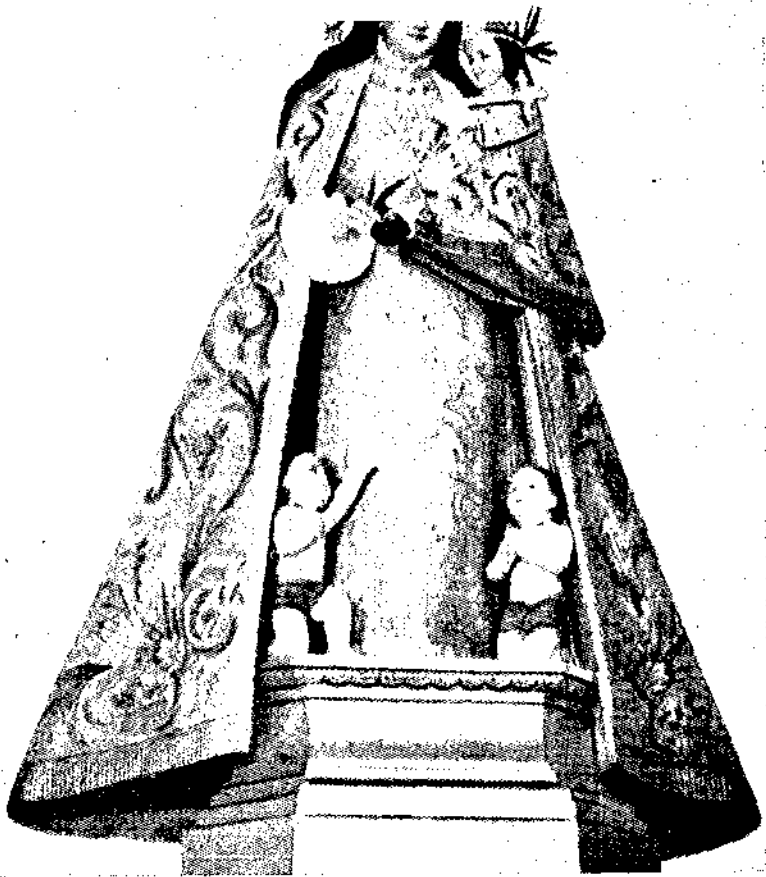
LA VIRGEN DE LOS DESAMPARADOS PATRONA DE CAMPELLO