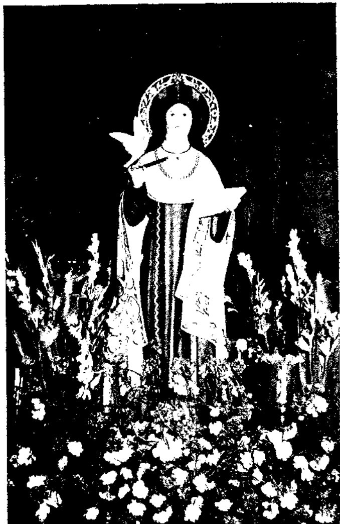
SANTA TERESA DE JESÚS TITULAR DE LA PARROQUIA